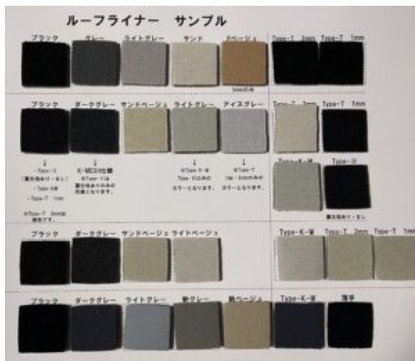
(Roof Change)ルーフライナーサンプル画像

様々な要因が関連して天井タレなどの現象が起こります。輸入車(外国車)特有の天井タレ・メクレ現象(まれに国産車でも)などの原因としては主に経年劣化、日本の湿気・温度、接着剤の種類などの様々な要因が関係して起こります。当店ではそのようなルーフライナーの成形・清掃、ウレタンの除去を行ない、その後に素材・色・ウレタンの厚みなどの異なる30種類以上の様々な新しいルーフライナーをご用意し、この中からお客さまのご要望に合ったライナーをお選びをし、元の状態に張替えをさせていただきます。